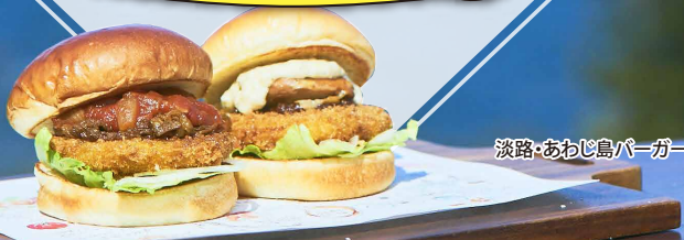
淡路・あわじ島バーガー