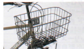
大型ワイド ワイヤーバスケット 上面:横460mm×奥行270mm 下面:横410mm×奥行210mm 深さ:230mm