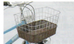
角型部分籐風 ワイヤーバスケット 上面:横380mm×奥行270mm 下面:横290mm×奥行205mm 深さ:230mm