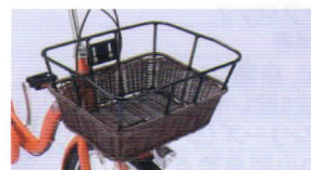
アルミ角型 部分籐風バスケット 上面:横370mm×奥行300mm 下面:横270mm×奥行220mm 深さ:210mm