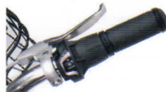
レボシフト(シマノ) グリップから手を離さず 楽々シフトチェンジ