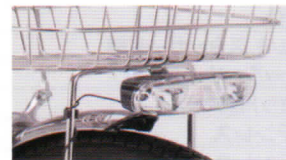
LED自動点灯ライト(4LED) 暗くなったら自動点灯 4LEDワイド配光サイドLED 視認性が大幅UP