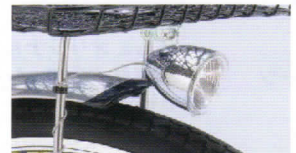
LED小型自動点灯ライト ヘッド部のセンサーにより 暗くなったら自動点灯 シンプルなフォルム