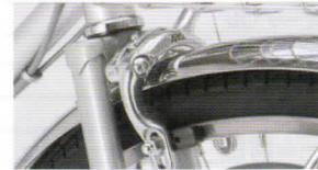
アルミダブルピポッドブレーキ 制動力に優れる ダブルピポッド機構