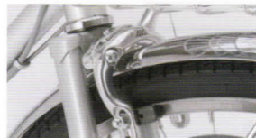
アルミダブルピポッドブレーキ 制動力に優れる ダブルピポッド機構