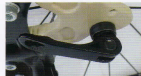
クイックリリース 車輪の脱着が簡単