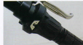
レボシフト(シマノ) グリップから手を離さず 楽々シフトチェンジ