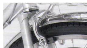
アルミダブルピポッドブレーキ 制動力に優れる ダブルピポッド機構