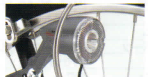
LED自動点灯ライト(S) ヘッド部のセンサーにより 暗くなったら自動点灯 リフレクター機能付