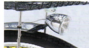
LED小型自動点灯ライト ヘッド部のセンサーにより 暗くなったら自動点灯 シンプルなフォルム