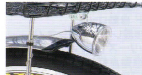
LED小型自動点灯ライト ヘッド部のセンサーにより 暗くなったら自動点灯 シンプルなフォルム