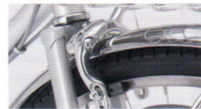
アルミダブルピポッドブレーキ 制動力に優れる ダブルピポッド機構