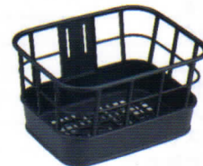
[オプション] 角型樹脂バスケット FB-063

上面:横415mm×奥行350mm 下面:横320mm×奥行250mm 深さ:250mm