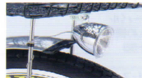
LED小型自動点灯ライト ヘッド部のセンサーにより 暗くなったら自動点灯 シンプルなフォルム