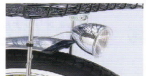
LED小型自動点灯ライト ヘッド部のセンサーにより 暗くなったら自動点灯 シンプルなフォルム