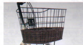
角型部分籐風 ワイヤーバスケット 上面:横380mm×奥行270mm 下面:横290mm×奥行205mm 深さ:230mm