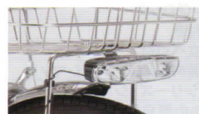
LED自動点灯ライト(4LED) 暗くなったら自動点灯 4LEDワイド配光サイドLED 視認性が大幅UP