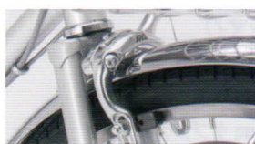
アルミダブルピポッドブレーキ 制動力に優れる ダブルピポッド機構