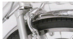
アルミダブルピポッドブレーキ 制動力に優れる ダブルピポッド機構